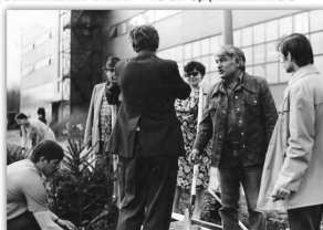
1980 год закладка аллеи голубых елей